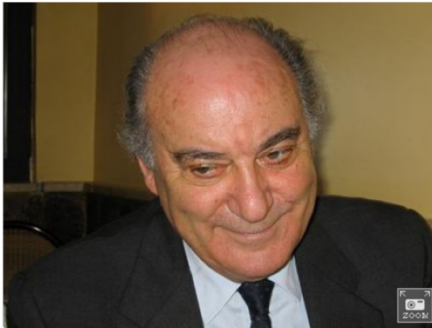
Giuseppe De Rita

Tutte le notizie su: Sociale De Rita Giuseppe CENSIS Italia